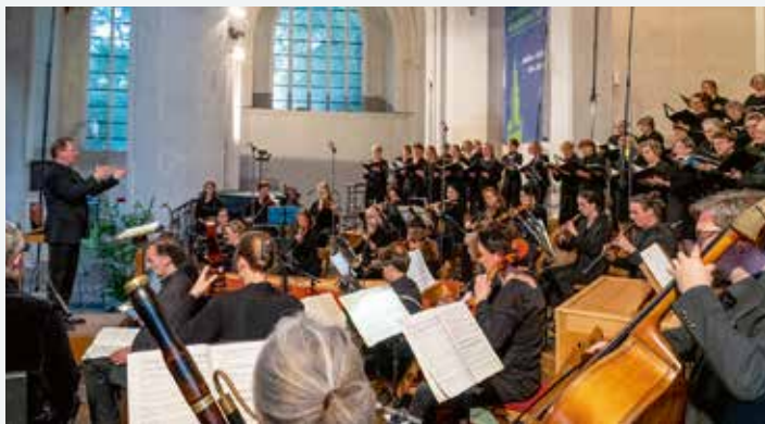
Der Greifswalder Domchor mit dem Orchester Musica Baltica bei der Aufführung der Johannespassion.