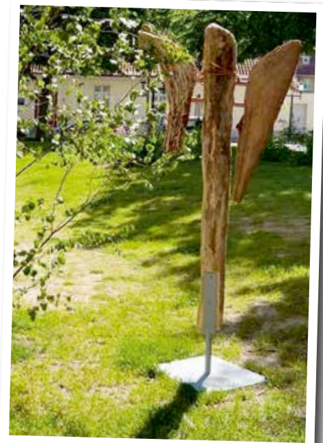
Im Mai war die Konfi-Gruppe noch einmal unterwegs: mit dem Rad auf der Insel Bornholm. Am Strand dort lag viel Treibholz. Das kam dann mit aufs Festland und wurde zur Konfirmation zu einem Engel im Mariengarten. Dank allen, die dabei mitgeholfen haben! ♦ Ulrike Streckenbach

In unserer Kirchengemeinde ist noch eine freie Bundesfreiwilligendienststelle (ab 27 Jahre, nach oben keine Altersbeschränkung, Teilzeit) zu besetzen. Sie umfasst die Betreuung der Besucherinnen und Besucher der offenen Kirche und die vielfältige Unterstützung der Gemeindearbeit. Bei Interesse oder Nachfragen melden Sie sich bitte bei mir! ♦ Bernd Magedanz