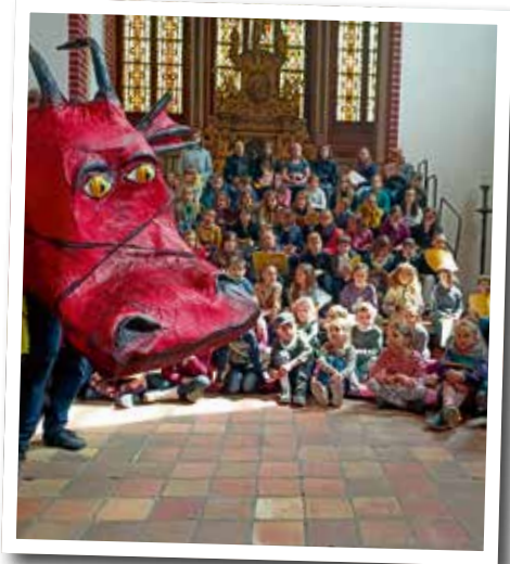
Mitte Mai fuhr der Kinderchor St. Marien zum Kinderchortreffen nach Neubrandenburg. In der St.-Johannis-Kirche wurde die Kinderkantate „Nur Mut“ (Georg und der Drachen) aufgeführt. ♦ Silvia Treuer