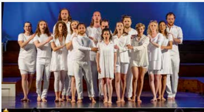
Ein besonderer Höhepunkt: die Gesang-Tanz-Performance des Ensembles Choreos aus Osnabrück.