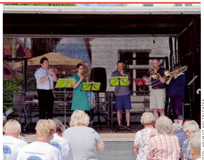
Andacht zur Eröffnung des Brückenfests in Wieck