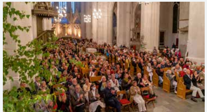
Fast 10.000 Besucher*innen erlebten die Konzerte der Bachwoche. Mehrmals war der Dom bis auf den letzten Platz gefüllt.